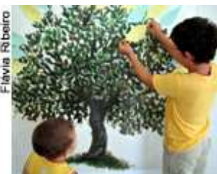
Semana do meio ambiente