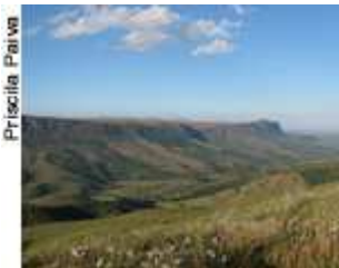
Serra da Canastra

O estudo biológico do pato-mergulhão pretende fornecer subsídios para as ações de proteção da espécie.