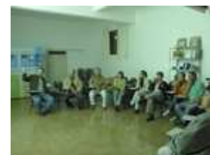
Palestra: Legislação Ambiental sobre a Água

A outorga da água é o instrumento que assegura o direito de utilizar os recursos hídricos.