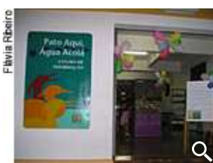
Evento Feliz Aniversário