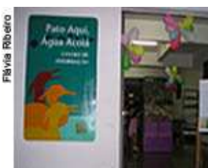
Centro de Informação Pato Aqui, Água Acolá