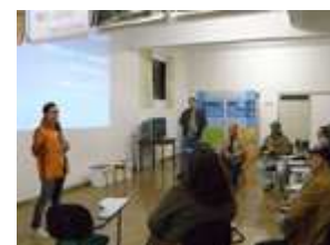
II Café com Prosa

Além disso, foi apresentado o programa Bolsa Verde, buscando estimular os produtores rurais a participarem desta iniciativa. O Bolsa Verde é um programa do Governo do Estado de Minas Gerais que tem por objetivo apoiar a conservação da cobertura vegetal nativa, mediante pagamento por serviços ambientais aos proprietários que já preservam ou que se comprometem a recuperar a vegetação nativa em suas propriedades.