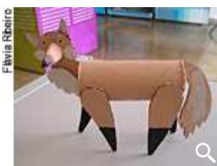
Oficina de artesanato