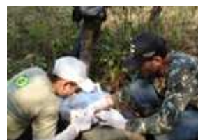
Coleta de material biológico