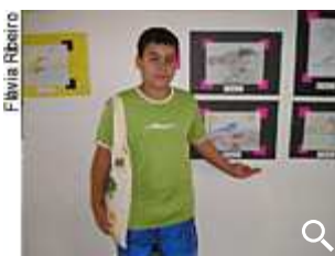
Concurso de desenho