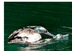
Casal em cópula

Com esses resultados, ainda preliminares, já é possível concluir que a continuidade da atividade de marcação é essencial para melhor compreender estes padrões de comportamento, dentre outros inúmeros aspectos da biologia da espécie. Estes e outros resultados do monitoramento das aves marcadas serão apresentados no XVII Congresso Brasileiro de Ornitologia , no próximo mês, em Vitória-ES.