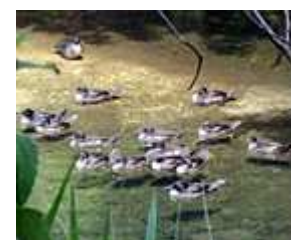
Grupo de patos-mergulhões

Estes e outros resultados do monitoramento serão apresentados no XVII Congresso Brasileiro de Ornitologia.