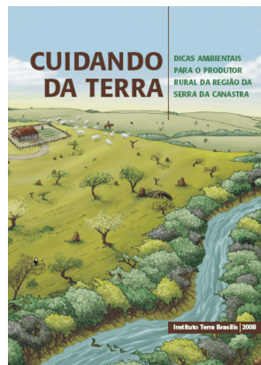
Capa da publicação

Mais de 80 pessoas assistiram às palestras sobre Agrossilvicultura e Reserva Legal.