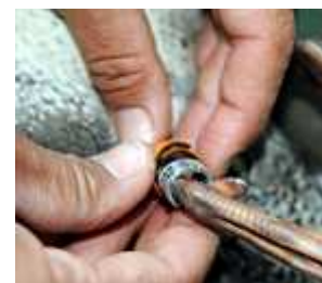
Verificação das anilhas