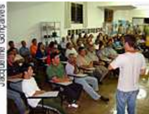
Palestra Reserva Legal

Mais de 80 pessoas assistiram às palestras sobre Agrossilvicultura e Reserva Legal.