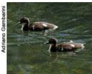
Filhotes do pato-mergulhão